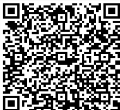
Figure 1: Foliensatz